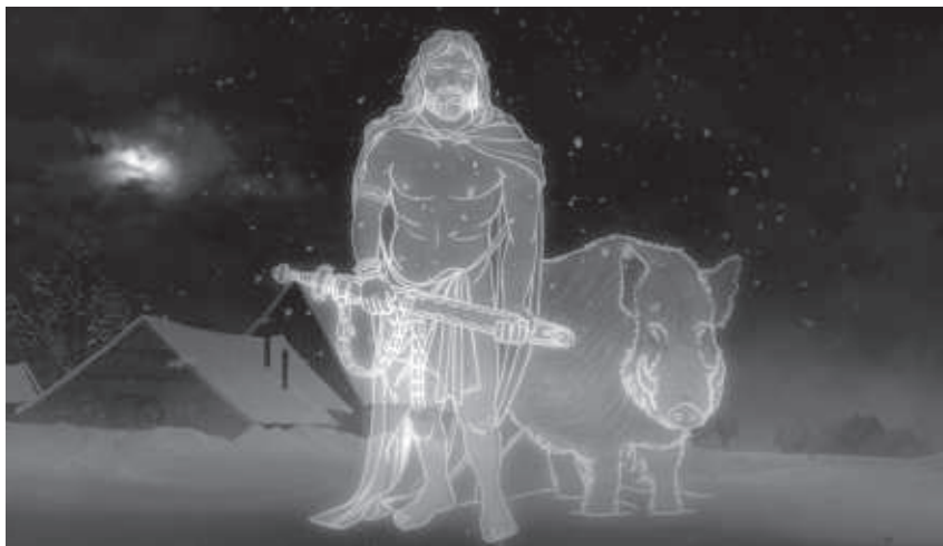
Derk met de beer in een donkere kerstnacht

bijgeloof". Daarin verwerkte hij zelfs, zij het op een wat sceptische manier, informatie uit de eerste hand, te weten een relaas van een arbeider die naar zijn zeggen zo'n veertig jaar eerder de Schelle-Guurkensbelt zich had zien openen en de daarin schuil gaande zilverschat had aanschouwd... In het artikel komen verder de Duivelskolken bij Lochem aan de orde, die ook een rol spelen in het gedicht Jaromir in Lochem, en het verhaal van Derk met de beer, de Waterbullebak en de Heggemoeder. Wie is er als kind nog met deze verhalen bang gemaakt?