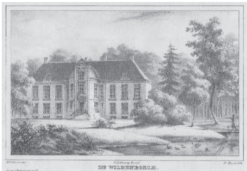
De Wildenborch in de tijd van Staring

uitgemaakt van de gemeente Laren, waar Barchem ook onder viel, en was Staring enkele jaren maire (burgemeester) van Laren.